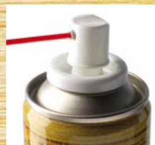
CON LA CANNULA